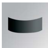
Pantalla direccional 180° Écran directionnel 180°